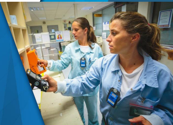
Contrôle de radioprotection