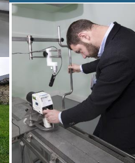
Chantier-école de l'INSTN