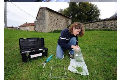
Plateforme DOSEO © CEA Surveillance de l'environnement © CEA